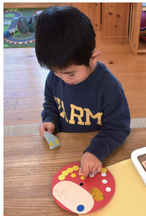
どんなお顔にしようかな？