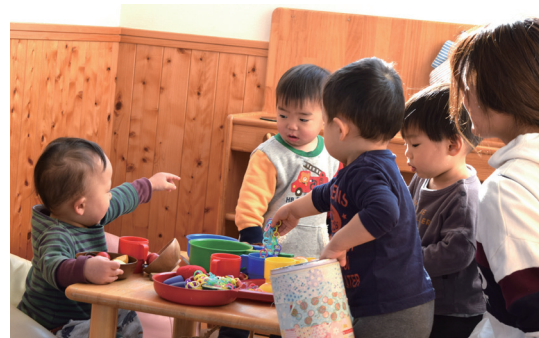
ナーサリのお友だちと遊んだよ