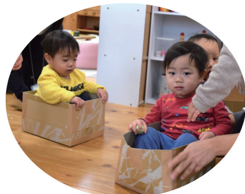
収集車がとおりま〜す