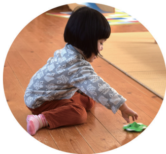
じょうずに まわせるよ♪