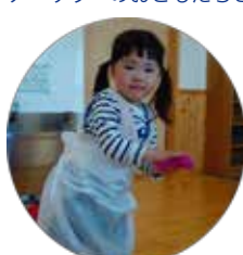
プリンセスポーズ♡ オーガンジーの布をドレスのように巻くのが、