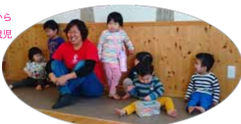
ナーサリーのおともだちと♪

2階『ナーサリー』からときどき、0歳児1歳児のおともだちと先生が、3階のきのこへ遊びに来ていまーす！