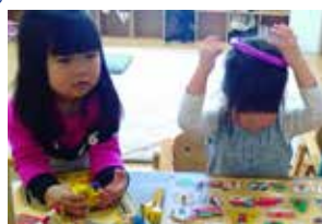
おともだちといっしょにボードあそび♪