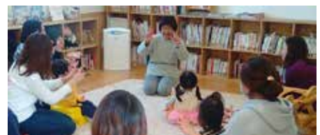
「コロコロたまご〜は〜、おこさん♪」