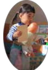
いそがしいのっ 女の子のお気に入り☆