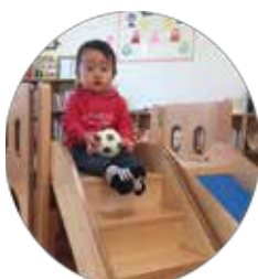
ふーっ (すべりだいの上でくつろぎ中)