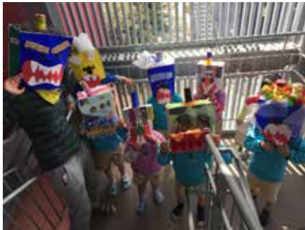
ようちえんかぞくのオニたち (3・4・5 歳児)