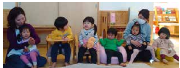
2月生まれのおともだち と お祝いされたいおともだちも前に…(笑)

2月生まれの4人のおともだちをみんなで祝いしました。手遊びは「コロコロたまご」、絵本は「うさぎのにんじん」を読みましたよ。HAPPY BIRTHDAY!!