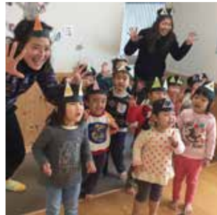
ナーサリーかぞくのオニたち (2 歳児)