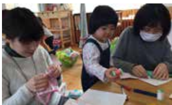
ちくちく…ぬいぬい…

3組のママが参加してくださいました。リピーター参加率が高かった今年度の『ぬいぬいしましょ』。「手芸が苦手」「家では集中できないよ〜」というママたちに、大好評です。