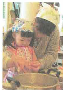
おなべにいれるよ