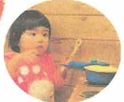
もっとつくるよー♪