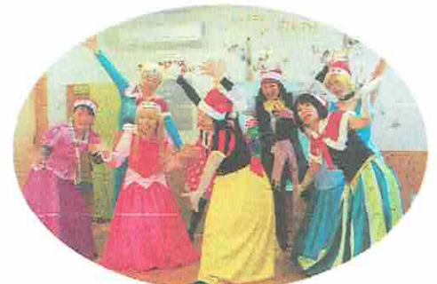
ダンス部 アンティ