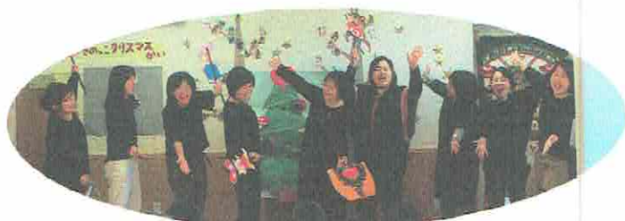
ゴスペル部 はまペラーズ