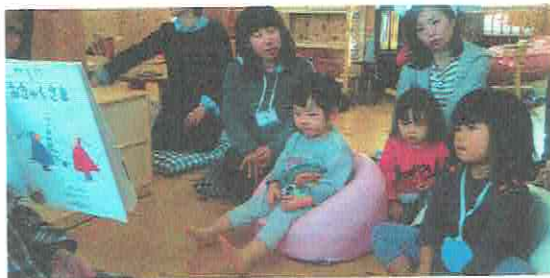
だれがきたのかなー?

あいにくの天気でしたが、 10組の親子が参加してくださいました。 親子でのおもちつき・おもちを食べるのが初めてのおともだちもいましたね。