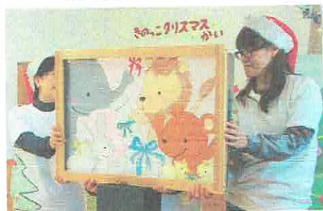
きのこオリジナル紙芝居「森のクリスマス」