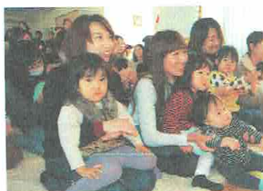
ママのおひざのうえ♡