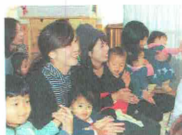
「(ダンス部) かわいいーっ!」