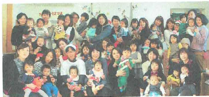
☆メリークリスマス☆