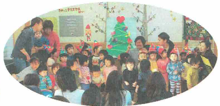
ナーサリーかそくのおともだち(0・1・2歳)