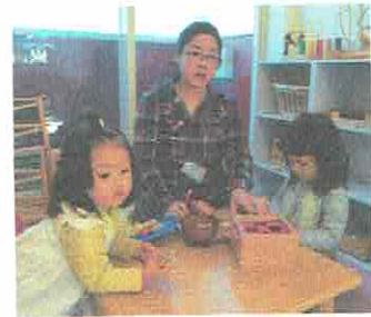
いっしょにあそんでまーす!