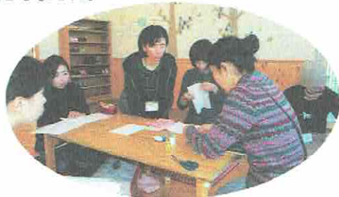
ぬいぬいの先生は「はっちゃん」です♡