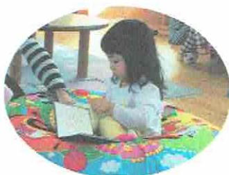
スポツとはいって、「えほんよんで〜♡」