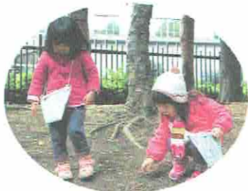
どんぐり、みーつけたっ