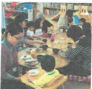
おひるごはん、いただきます☆