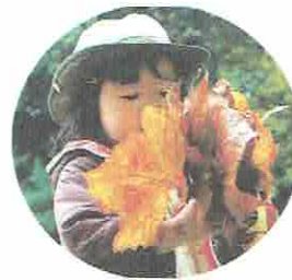
いっぱいひろったね