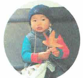
えきのペンチで ほっ