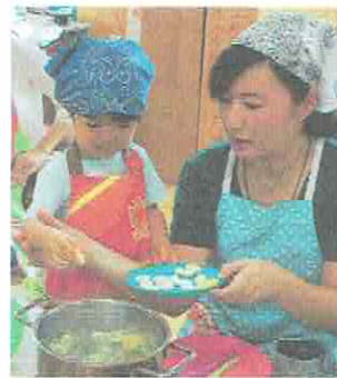
そーっといれるよ