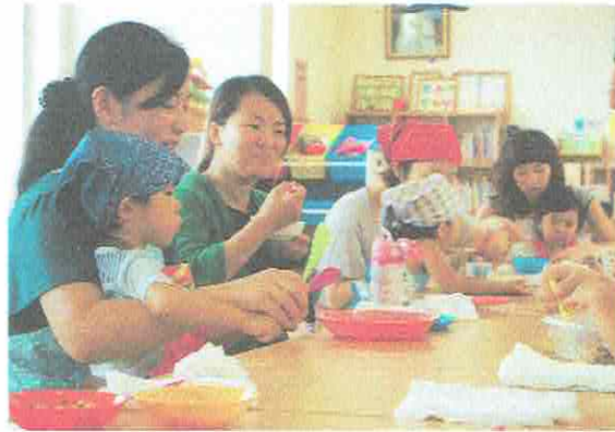
おいしくできたねー