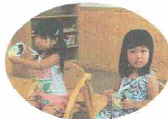
メダルをもらったよ