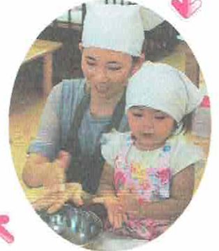
ママといっしょに