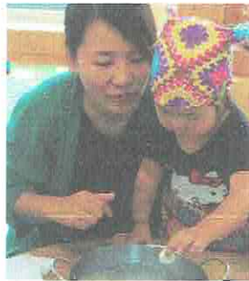
そうそう！ゆっくりね