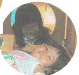
ふたりでにっこにこ