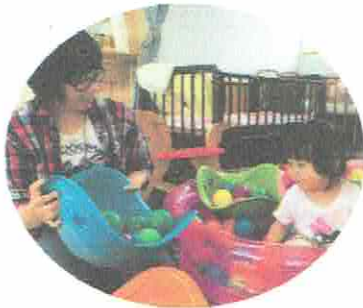
おかあさん、ちよっともっててね

もうすぐ、プール開き。まずは、ボールプールに入ってみましょうね。と、きのこに、ボールプール登場！みんなたくさん遊んでいますよ。