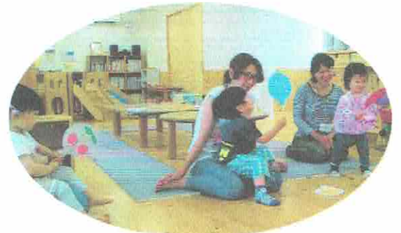
くるくるくると、へんしーんっ

6月生まれのおともだちをみんなでお祝いしました。いろんな色のふうせんが風に吹かれて、変身するたのしいペーパーサートをしましたよ。