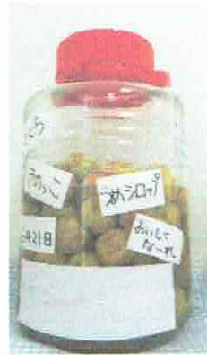
2日後。梅の汁がでてきました