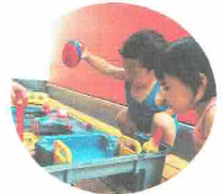
おふね、しゅっぱーっ！