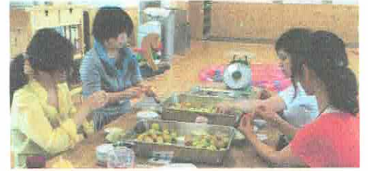
おしゃべりしながらのたのしい時間♡