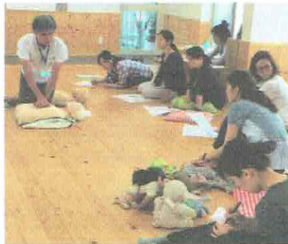
理事長ハタ(尼崎応急手当普及員)による講習会