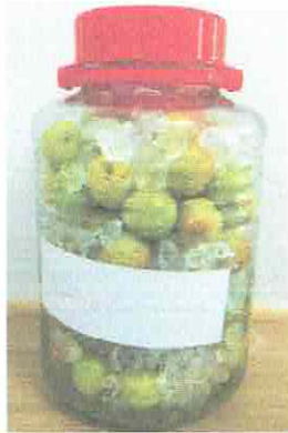
6月21日。詰めたところ