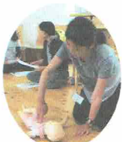
乳児は指で・・・