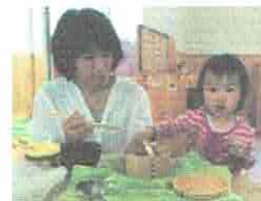
ママのてづくりおべんとう♡