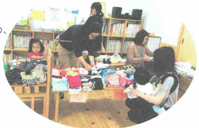
これもいいね♡あれもいいね♡