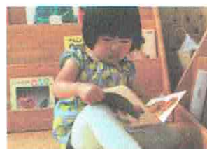
ひとりでよめるよ