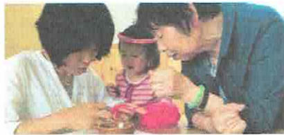
うんうん、できてる！