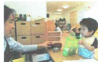
おかいものについてきたよ～