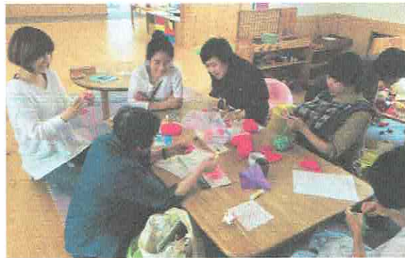
「編み物に集中すると、気分転換になっていいよね～」