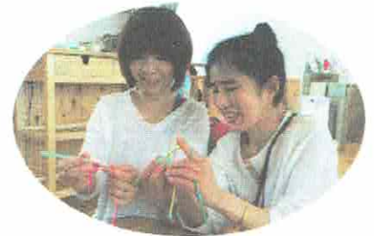
ここは、こうやって…