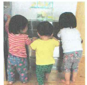
おみず、ベタベタ、だ～いすき☆