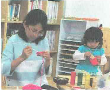
ママはあみもの。おちやをいれてあげるね。