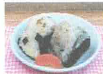
こども用おにぎり