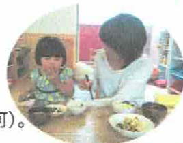
ようちえんの給食♡