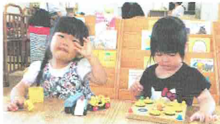
ママー、おともだちとあそんでまってるね！

たくさん子ども服と、マタニティ・赤ちゃん用品が集まり、きのこ ECO マーケットもおおにぎわいでした♡みんな、お気に入りの服は、見つかったかな？