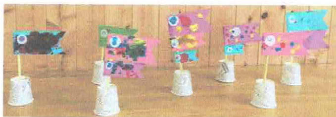
みんなのこいのぼり

指で絵の具を『ポンポン』したり、『ぬりぬり』したり♪クレヨンでお絵かき、シールをぺったん！「うまれてはじめての親子製作」だったおともだちも多かったですね。おんなのこのママは、「うちにはこいのぼりがいないからうれしい♡」とってくださいました。