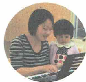
「Happy birthday to you〜♪」