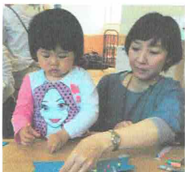
ママといっしょに♪