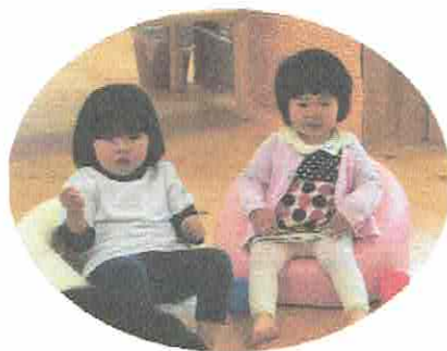
4がつうまれのおともだち