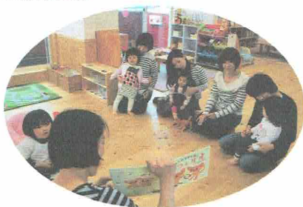
どんなおうたがでてくるのかな？