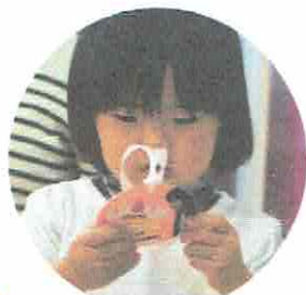
メダルのプレゼント