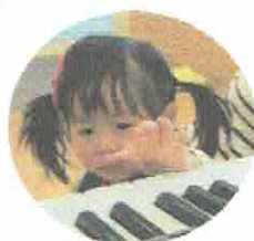
いいおとするかな？