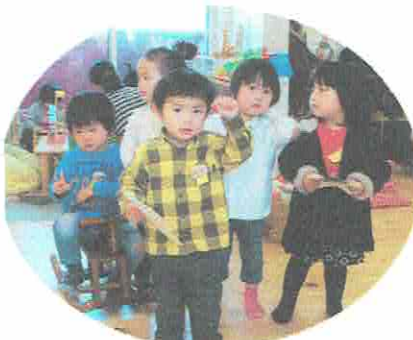
4がつから、ようちえんにいきまーす