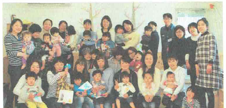
みんな おおきくなりました♡