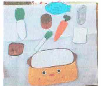
ぐつぐつにーまーしょー♪