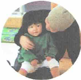
HAPPY BIRTHDAY ☆