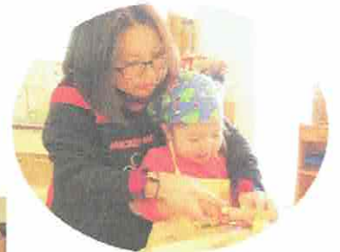
いっしょにおりょうり♡