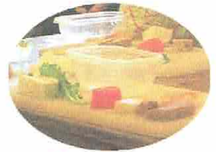
まな 大根・真菜・人参・もち・れんこん・ こんにゃく・薄揚げ