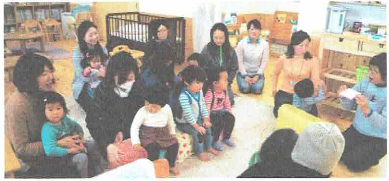
きょうは、だれのおたんじょうかいかなー?