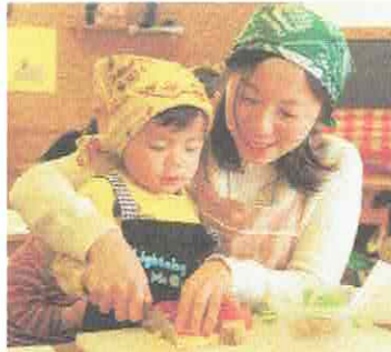
いっしょに、トントン!

7組の親子が参加してくれました。あったかーいかず汁とおにぎりを作りました。たくさんおかわりをしてお鍋いっぱいのかず汁も、あつという間になくなりましたよ。親子でクッキング、だーいすき☆