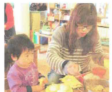
さあ、いただきます♪