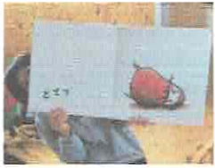
いっちゃんも「どてっ」

1月生まれのおともだちのお誕生日をお祝いしました。ナーサリーのいっちゃんに「だるまさんが」の大型絵本を読んでもらいました。