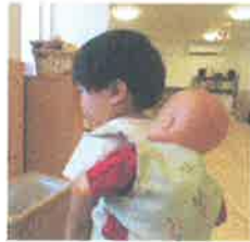
ぼくのおかちゃん♡

きのこスタッフ手作りの だっこひもで、お人形を おんぶしたり、だっこしたりが お気に入りです♡