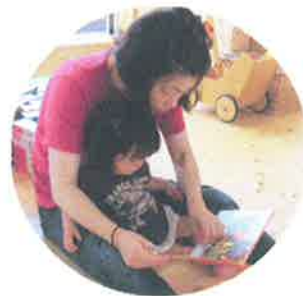
「おめでとう」だって