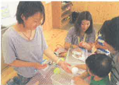
いっしょにつくりましょっ

3組の親子が参加してくださいました。 クエン酸と重曹に水分を少し加えながら混ぜ、 型に入れ固めればできあがり♪ 「今夜、さっそく使います！」と楽しみに 帰られました。