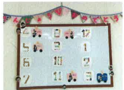
6月のおたんじょうびは、だれかな??