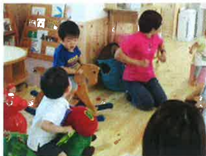
パッカパッカパッカパッカッ…わははは(笑)