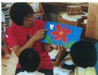
ちょうちよがとんでるね (^_^)