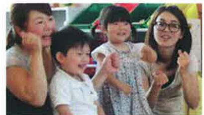
♪だーんごだんごくっついたー