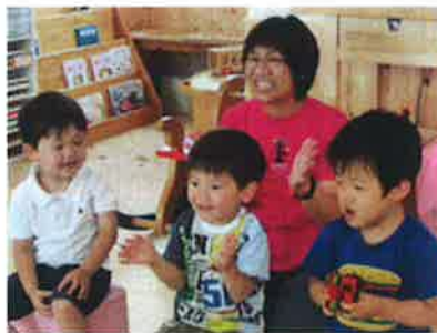
はくしゅで「おめでとー★」

5月生まれのおともだち二人をお祝いしました。みんなでにっこりわいわいのお誕生会でした。手遊びは、「だんごだんご」をしました。