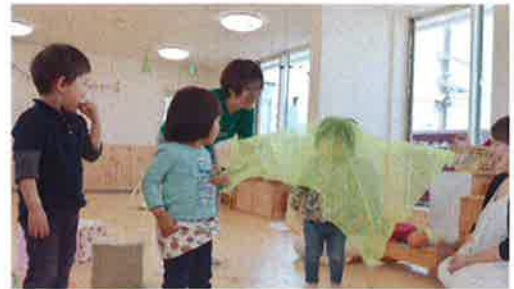
あげたりさげたり、あげたりさげたり・・・

みんなで「ハッピーバースデー」を歌って、おめでとうのパチパチ拍手のプレゼント。絵本を見たり、布遊びをしたりして楽しみました。