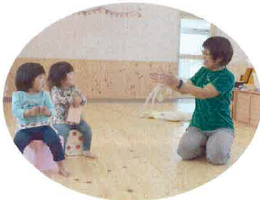
おたんじょうびおめでとう！！