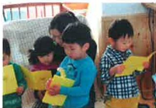
こんなこともしたね～