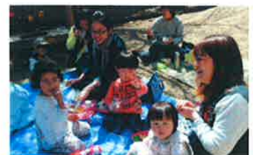
みんないただきます

おひさまもこの日を楽しみにしていたかのように、ぽっかぽかあたたかなランチタイム♪桜の木の下で、みんなでわいわい食べるお弁当はいつもの何倍ものおいしさだったね。お弁当のあとは、園庭で水あそびなどをたのしんだり、のんびり遊びました。