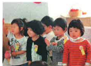
こんなに大きくなりました