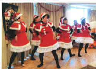
ダンス部アンティさんはまペラーズさん 今年もありがとうございました。