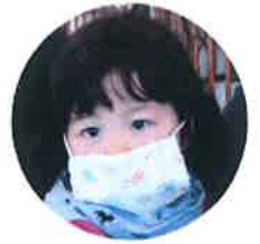
ママが作ってくれたよ☆