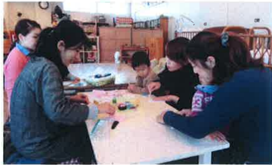
みんなでワイワイ つくったよ