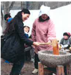
ママがんばってー