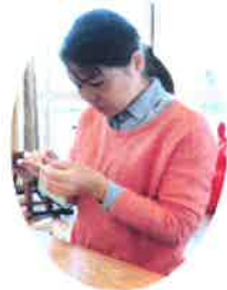
愛する息子のために♡