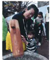
べったんべったん