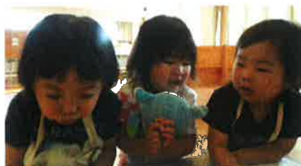
あかちゃんだっこしてるの♪

ママといっしょにすごしていたおともだちも、少しずつ子ども同士でよく遊ぶようになりました。エプロンを抱っこ紐にしてあかちゃんのお世話をしたり、牛乳パックの乗り物に乗ったり押したりするのがだいすきです！！