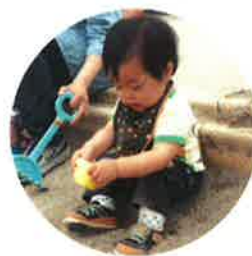
プリンつくってるよ