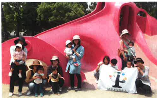
みんなで「はい、チーズ！」