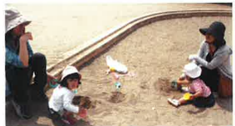
おすなばともだち♡

7組の方が参加して下さいました。心配していたお天気も、蒸し暑いくらいの陽気になり、お砂場で遊んでいた子ども達も汗がじわーっ。また遊びに行こうね。